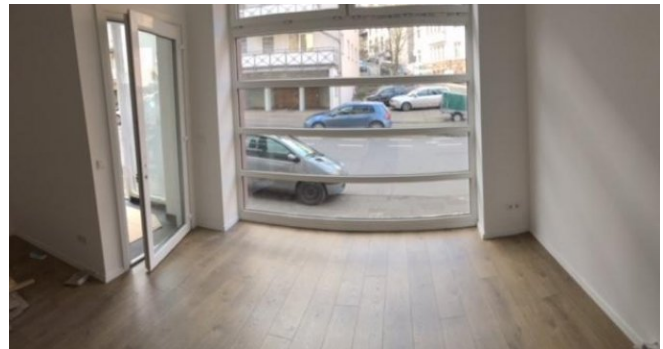
Blick nach außen