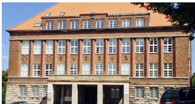
Haus der Ruhrkohle