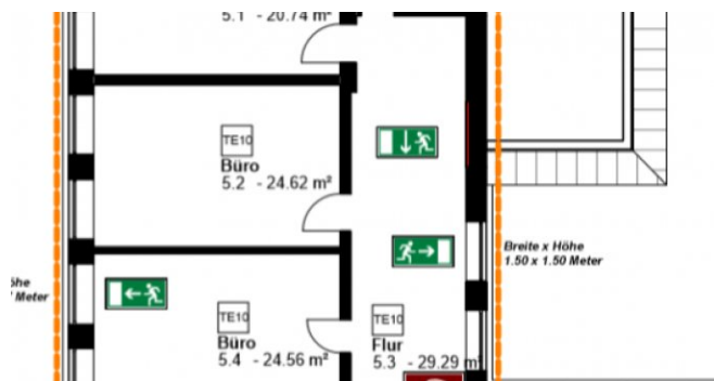
Haus der Ruhrkohle - TE10