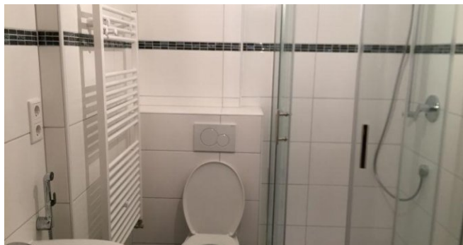
Bad (Beispiel ohne Badewanne)