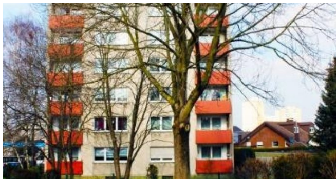
Ansicht von Hagener Straße